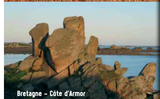
Bretagne - Côte d'Armor