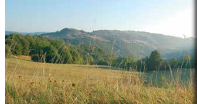
Bordure du Larzac - Nogaret