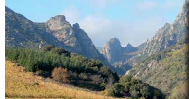
Haut-Languedoc - Vallée de l'Orb et du Jaur

Graphisme Véronique Bianchi 04 67 97 84 09